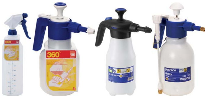
EP01 DELTA TEC 2 TEC ONE 2000 K

Aine levitetään puhdistettavalle pinnalle, annetaan vaikuttaa 5 - 20 min. Hankaa tarvittaessa sienellä tai harjalla. Pyyhi pinta liinalla, sienellä tms. puhtaaksi tai pese painepesurilla. Toista käsittely tarvittaessa.